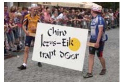
Het feestjaar van Chiro Bosuil begint met de overwinning van de Druivenstoet 2010. Proficiat !